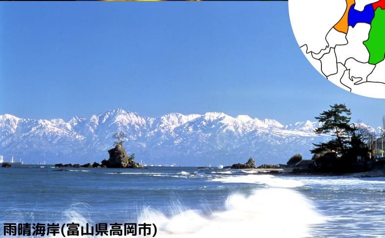
雨晴海岸(富山県高岡市)