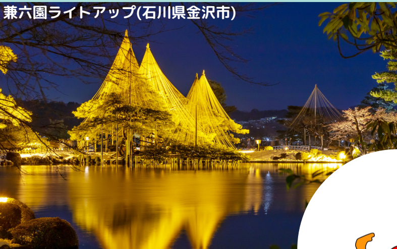
兼六園ライトアップ(石川県金沢市)