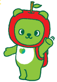
長野県PRキャラクター 「アルクマ」©長野県アルクマ