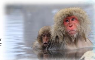
猿たちも待ってます