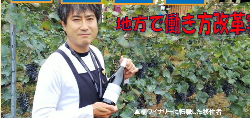
▲楠ワイナリーに転職した移住者