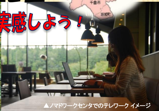
▲ノマドワークセンターでのテレワークイメージ