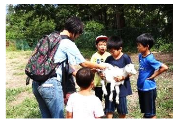
昨年の見学会の様子