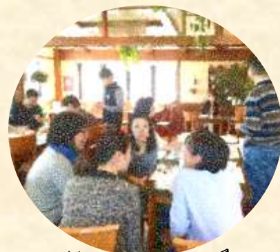
昨年の交流会風景