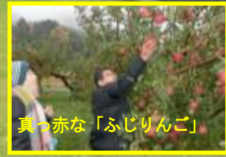
真っ赤な「ふじりんご」