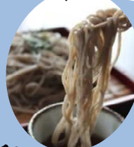
全国的にも珍しい “すがかわそば”