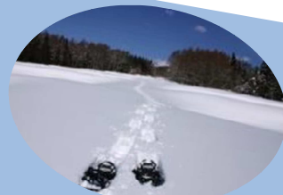
冬の大自然を満喫 スノーシュー