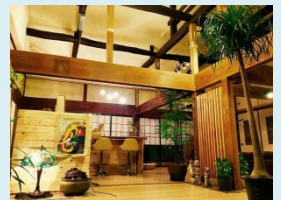
リノベーションした店内

地域の野菜を活用したメニューを提供するとともに、外国人を含めた旅行者への民泊サービスの提供も行っている。