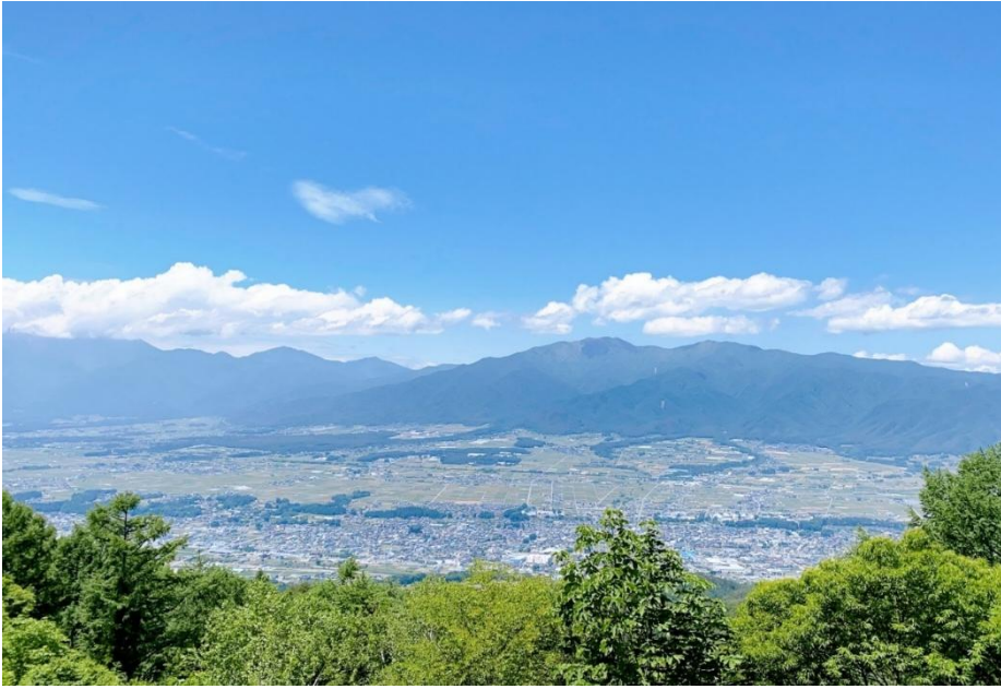
萱野高原 (標高1200m) からの絶景