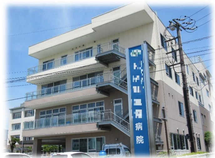
町内に総合病院も