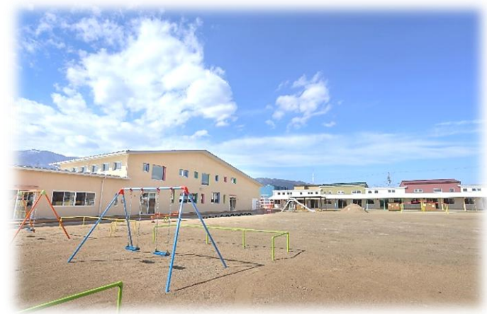
園庭の広い保育園!