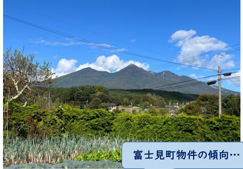
富士見町物件の傾向…

富士見町は「空き家バンク」に登録せず所有者の方から直接物件をお預かりしウツリスムのサイトに物件紹介・内見案内をしています！