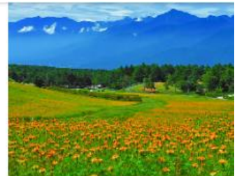
富士見高原リゾート