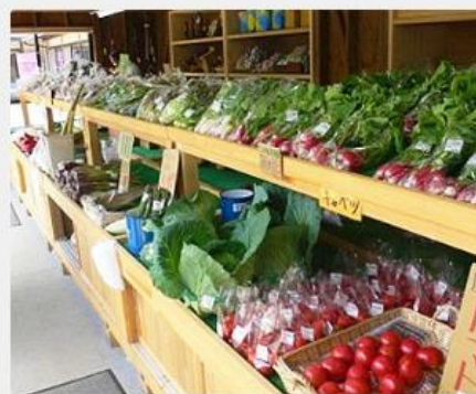
地元食材の直売所