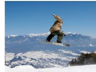
富士見パノラマリゾート