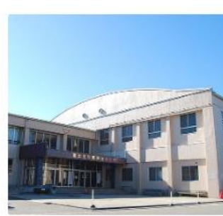
町民センター（体育館）