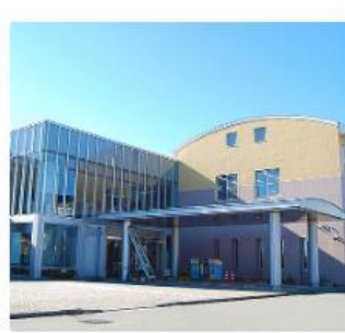
コミュニティプラザ、図書館