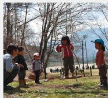
子育て広場 おさんぽ隊