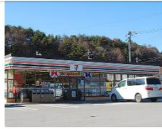
コンビニエンス・ストア