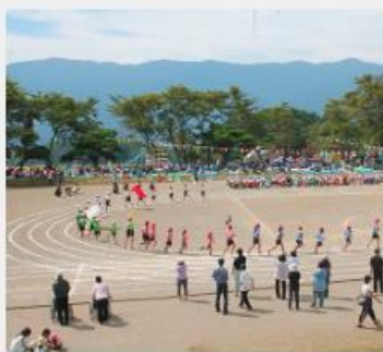
小学校での運動会