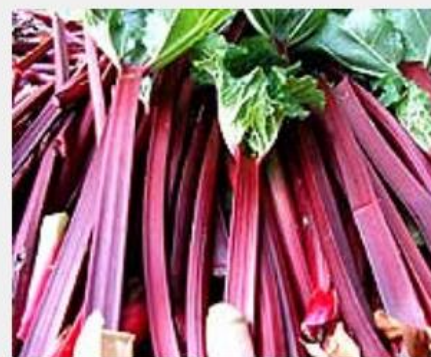
地元食材の赤いレバース