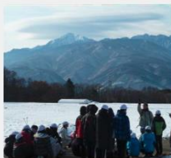
屋外での自然観察授業