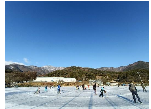
上古田スケート場（天然リンク）