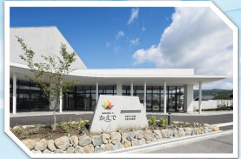
交流センター「かえで」