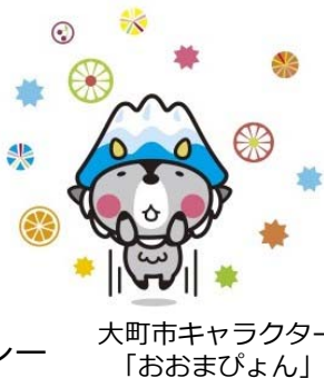
大町市キャラクター 「おおまびょん」