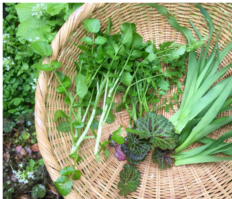
山の恵みとそれを活かす人の知恵が受け継がれています..