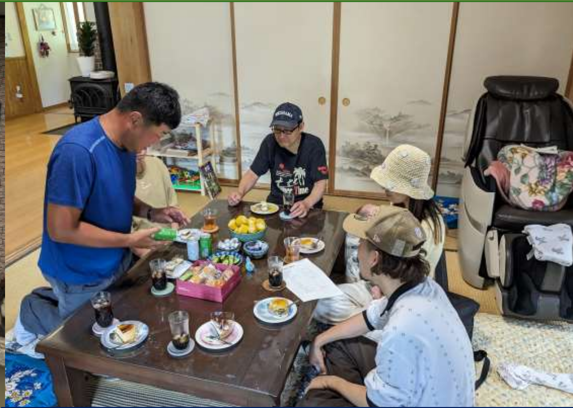
移住前にもご近所さんと顔合わせします