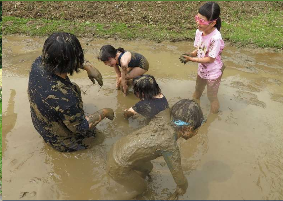
先生も全力でどろんこになります