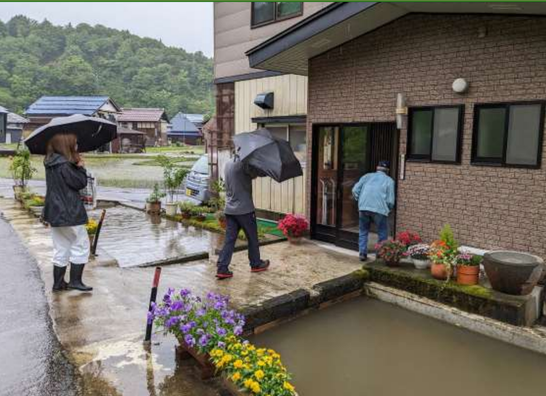
転入後の挨拶周りに同行します