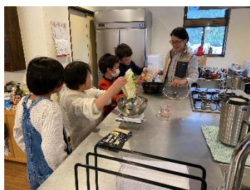
学校帰りに開放日に参加する小学生。みんなでおやつを作って食べたり、外遊びも大野川区ならではの発見があります。