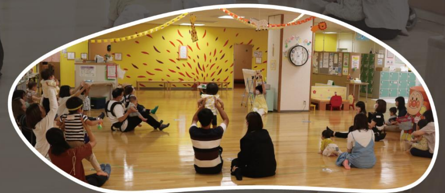
子育て応援施設「こどものくに」