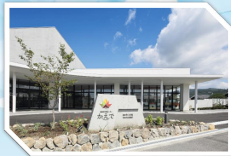
交流センター「かえで」