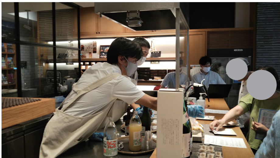
参加自治体 特産品の 試飲・試食