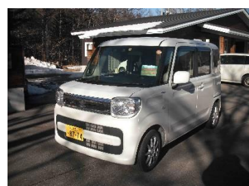
高齢者や高校生を送迎する車両。地域住民の協力により交通事情の悪さを解消しています。