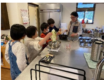
学校帰りに開放日に参加する小学生。みんなでおやつを作って食べたり、外遊びも大野川区ならではの発見があります。