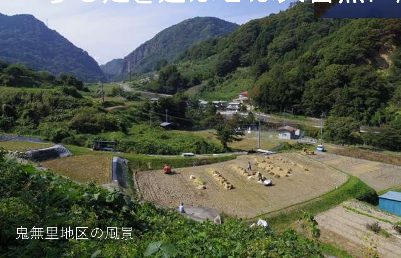
鬼無里地区の風景