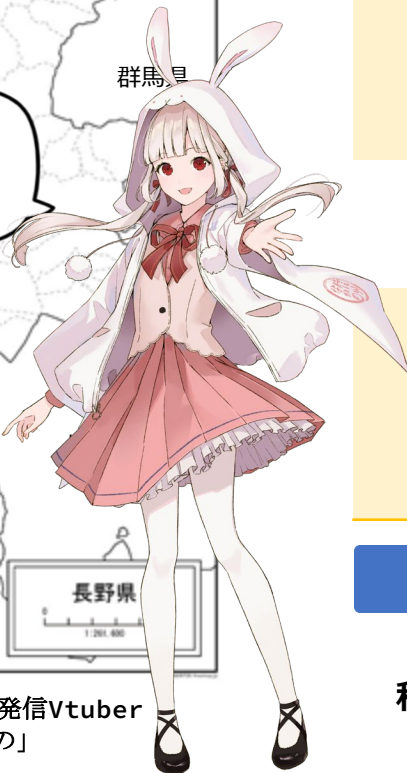
中野市魅力発信Vtuber 「信州なかの」

長野県の北部にあります。 新潟にも近いので、 海にも1時間くらいで 行けますよ～