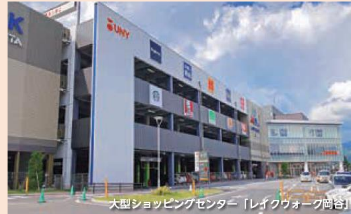
大型ショッピングセンター「レイクウォーク岡谷」

市役所をはじめ、市民病院やショッピングセンター、スーパーマーケットのほか、映画館から雑貨屋さんまで、生活に必要なものが中心市街地に集まっております。