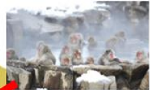
外国人観光客に 大人気！「スノーモンキー」 車で約20分