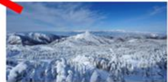
日本最大級のウィンター リゾート「志賀高原」 車で約30分