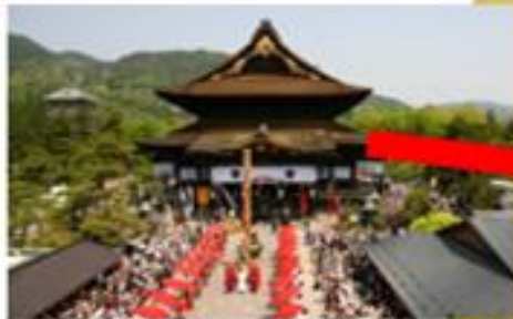
長野県と言えば…「善光寺」 車で約45分