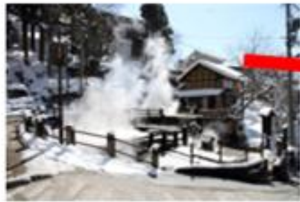
スキーと温泉の名所「野沢温泉」 車で約40分