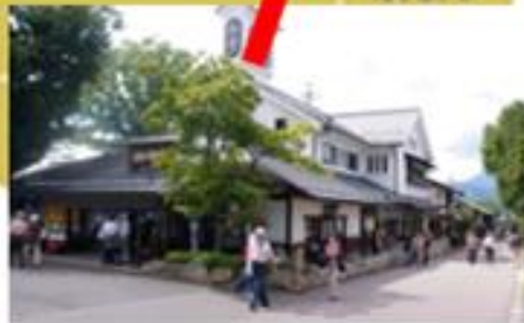
栗のまち「小布施」 車で約15分