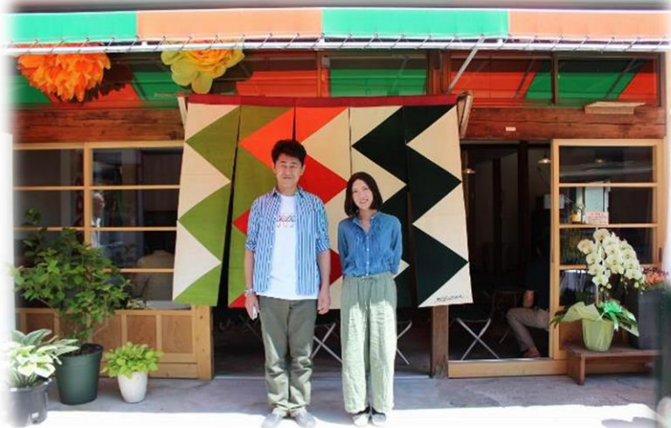
ゲストハウス 太陽堂