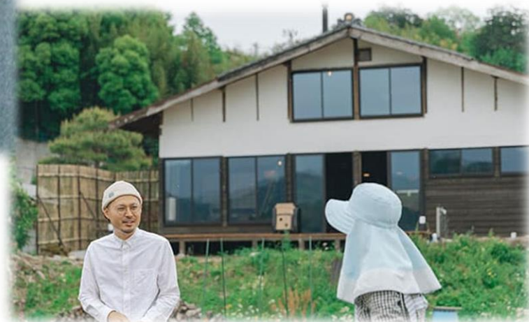
一棟貸しの古民家宿 燕と土と