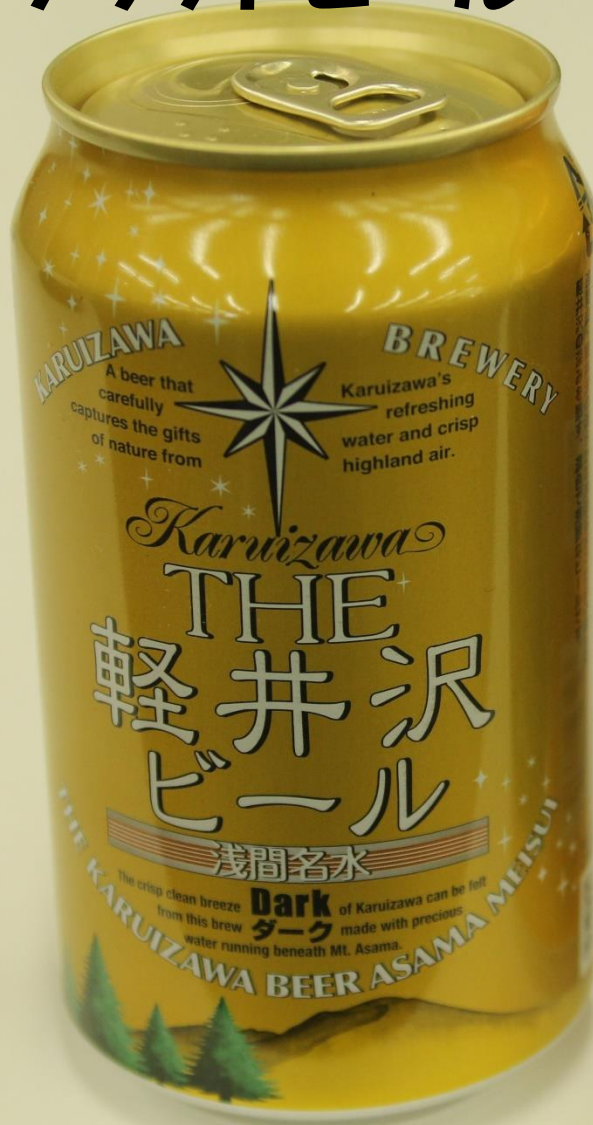
軽井沢フルワリー（株） THE 軽井沢ビール Dark