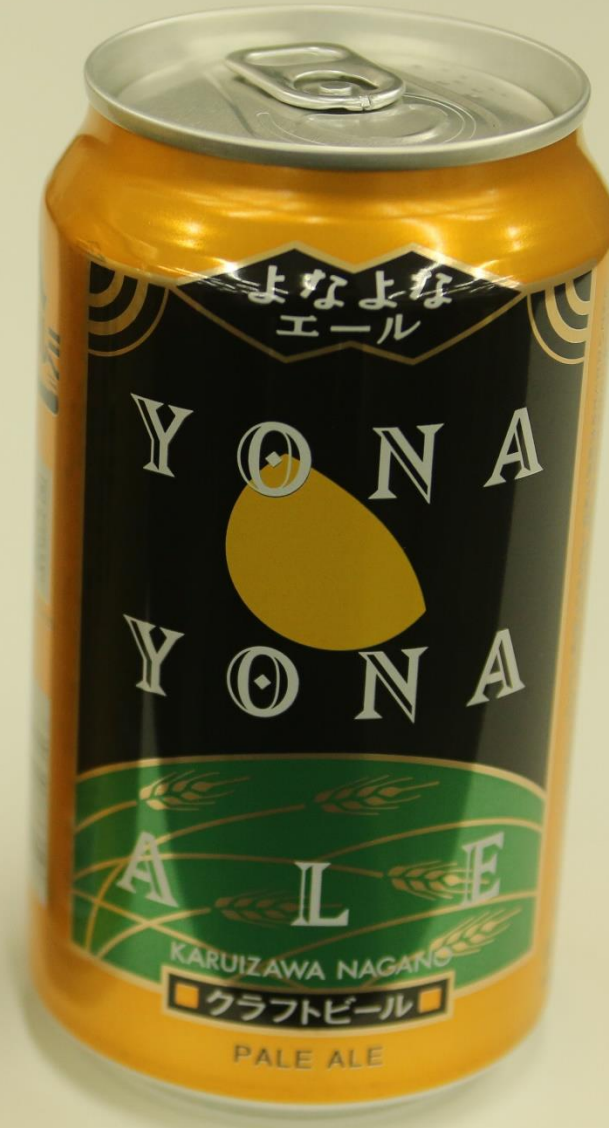
（株）ヤッホーフルーイング よなよなエール