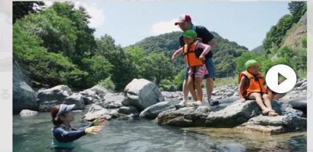
「がるがるっこ」動画編