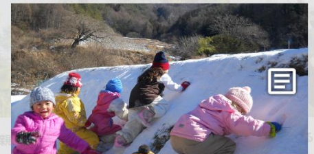
自然あふれる伊那市で子育て