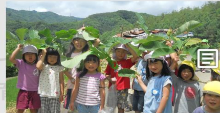
ワクワクを育てる「がるがるっこ」

子どもの「おもしろがる」「試してみたがる」「不思議がる」意欲や感性など、ワクワク、ドキドキを大切に育みま