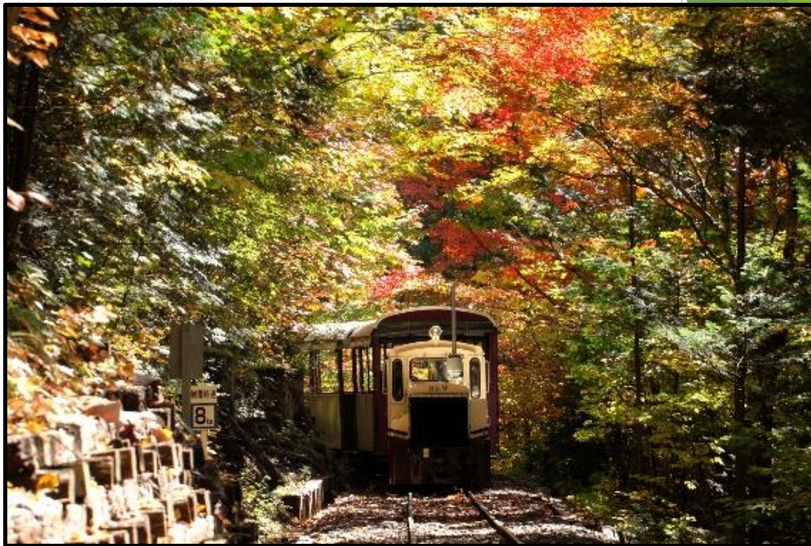
きそぐん あげまつまち 長野県 木曾郡 上松町