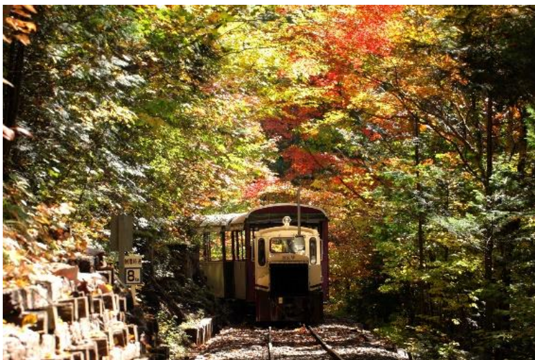
赤沢自然休養林 (上:赤沢森林鉄道)