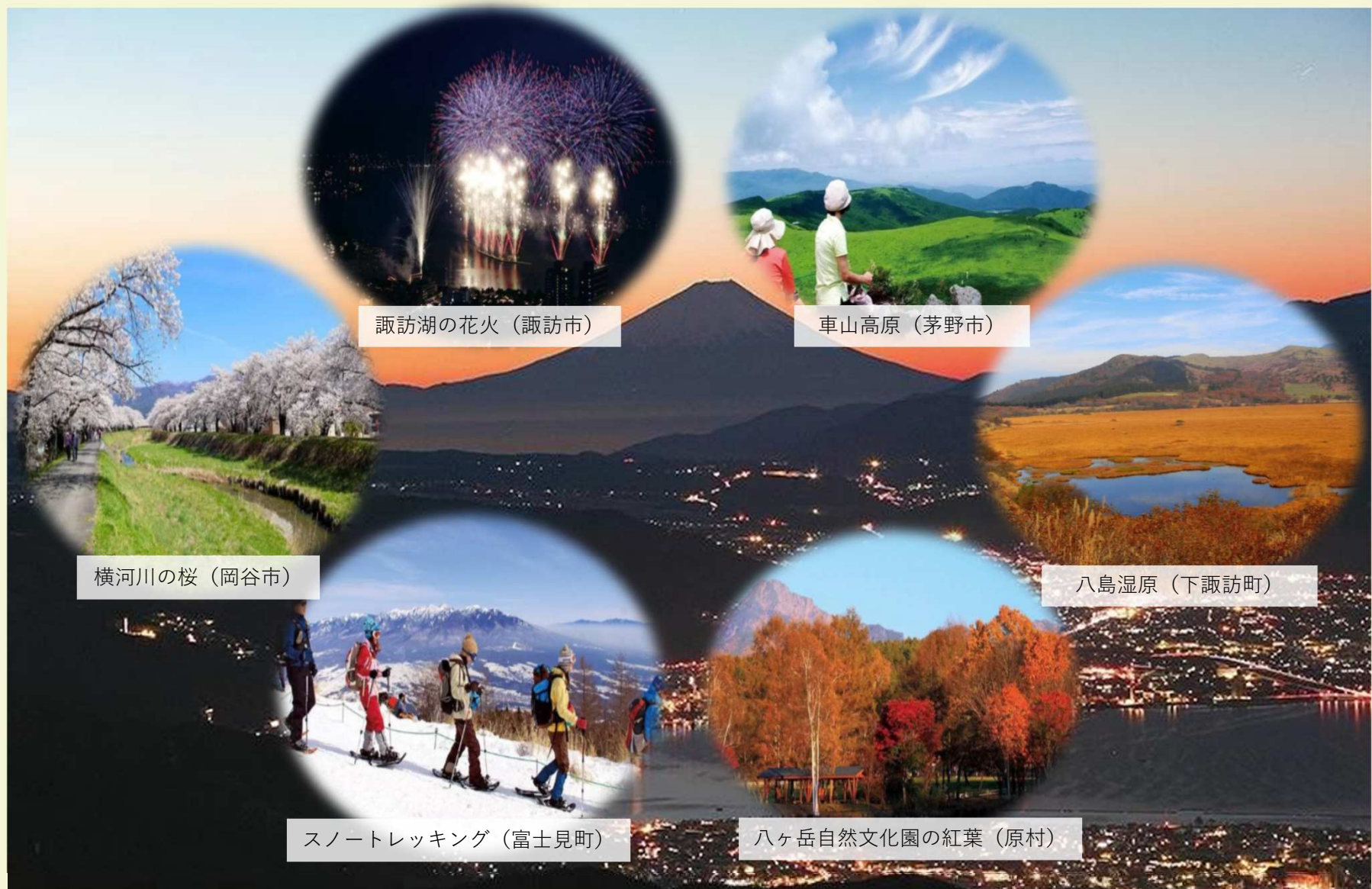
諏訪湖の花火 (諏訪市)