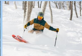
SKI SNOW BORD