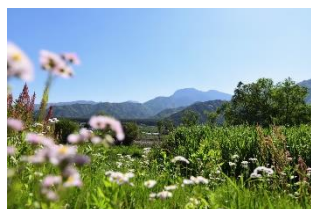
北アルプスと田園風景