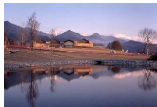
安曇野ちひろ美術館