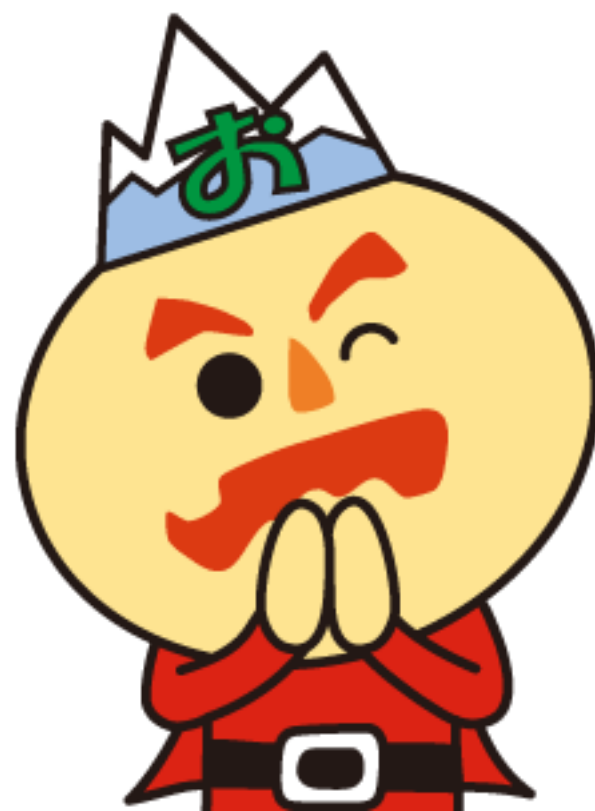
小川村マスコットキャラクター 「おやキング」