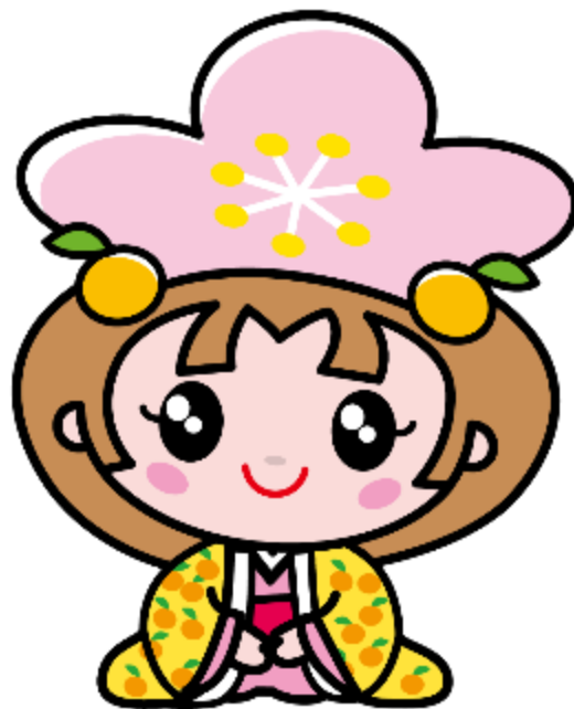
千曲市キャラクター あん姫

問合せはこちらをクリック↓ https://www.city.chikuma.lg.jp/cgi-bin/inquiry.php/42?page_no=2007