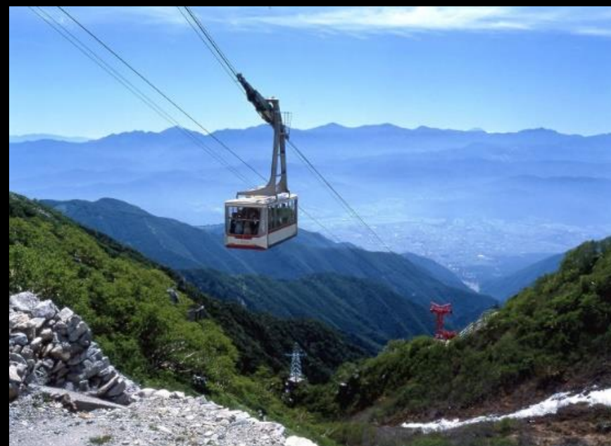
駒ヶ岳ロープウェイ