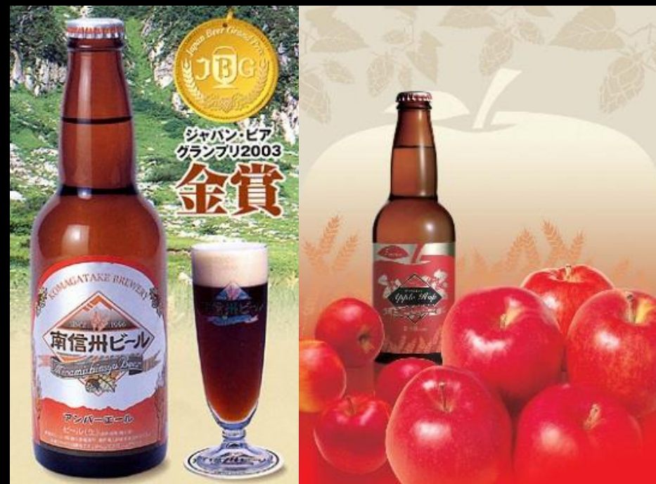
長野県初のクラフトビール