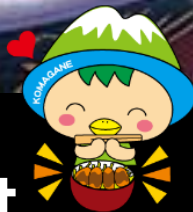
駒ヶ根名物ソースかつ丼