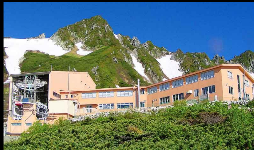
中央アルプス観光株式会社ホテル千畳敷

市のホームページにハロー ワーク伊那から毎週発行され る求人情報を掲載しています