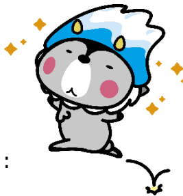
大町市キャラクター 「おおまびよん」