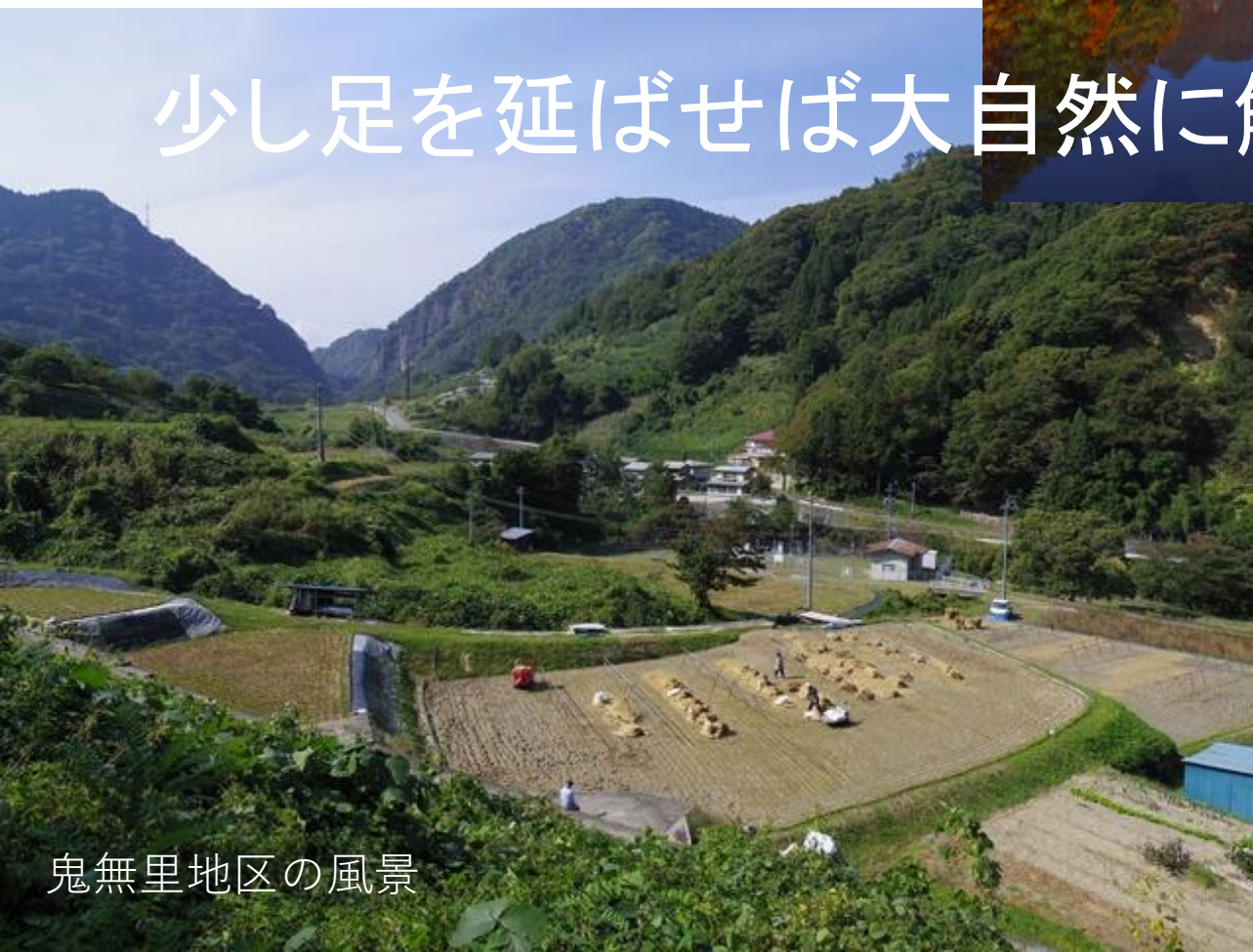
鬼無里地区の風景