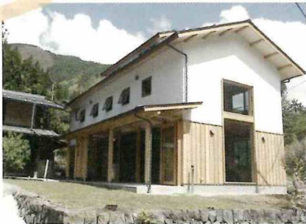
ゲストハウス かぜのわ