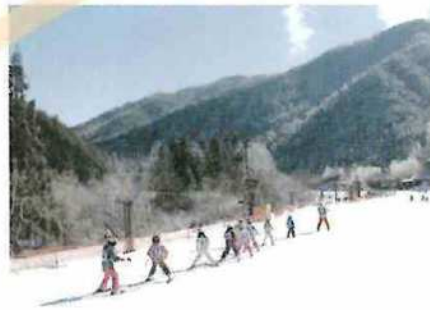
あさひプライムスキー場