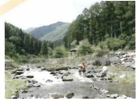
中俣せせらぎ公園