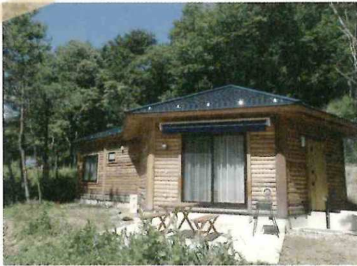
緑の体験館コテージ