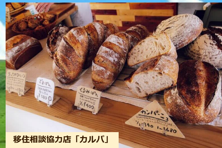
移住相談協力店「カルパ」