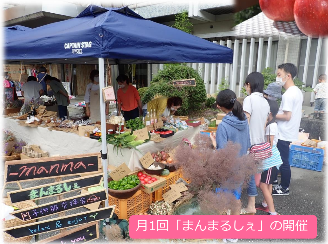
月1回「まんまるしえ」の開催