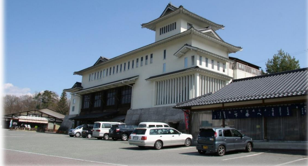
道の駅 信濃路下條