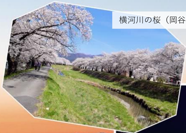
横河川の桜 (岡谷市)