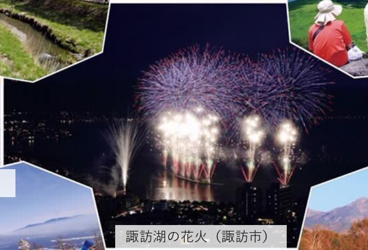
諏訪湖の花火 (諏訪市)