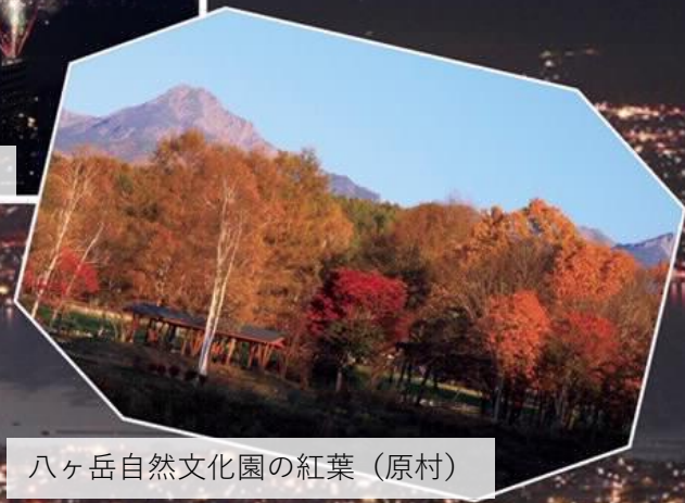
八ヶ岳自然文化園の紅葉 (原村)