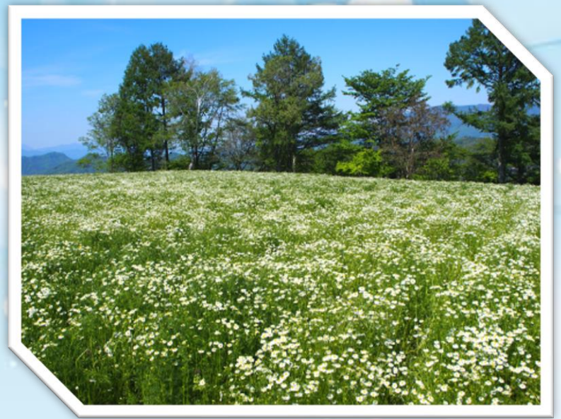
大峰高原のカモミール畑