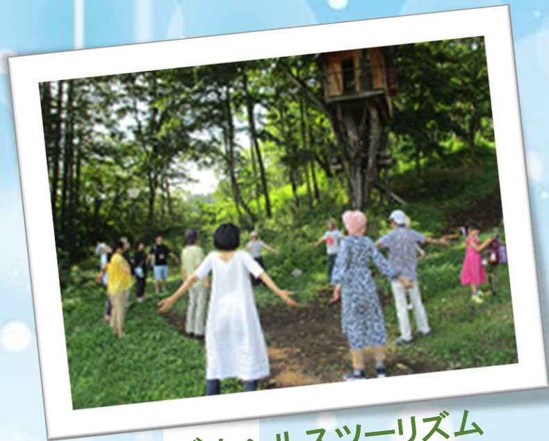
ハーバルヘルスツーリズム