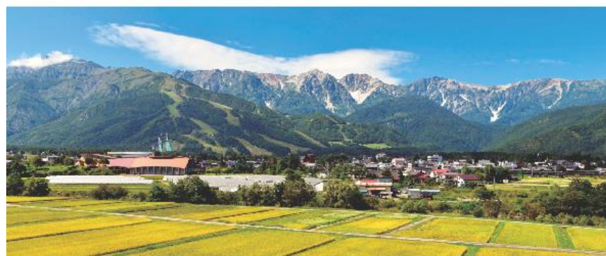
白馬村移住ガイドブック