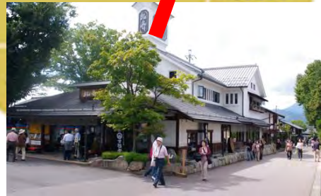
栗のまち「小布施」 車で約15分