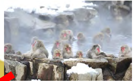
外国人観光客に 大人気！「スノーモンキー」 車で約20分