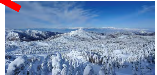
日本最大級のウィンター リゾート「志賀高原」 車で約30分