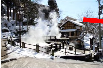
スキーと温泉の名所「野沢温泉」 車で約40分