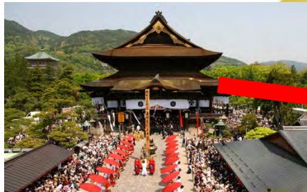
長野県と言えば…「善光寺」 車で約45分